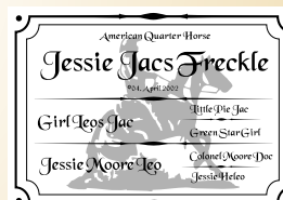
Muster CLASSIC R: Schmuck schwarz-weiss S: Barock

Zur Befestigung liefern wir zu jedem Schild edle Schrauben und Unterlegrossetten passend zu Ihrer Farbauswahl.