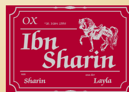
Muster DELUXE R: Schmuck Silber-Bordo S: Standard