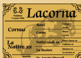
Muster DELUXE R: Barock Schwarz-Gold S: Standard