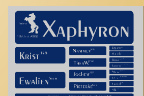
Muster DELUXE R: Modern Silber-Blau S: Modern