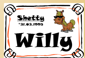
Muster EXTRA R: Comic Rot-Weiss S: Comic