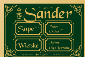
Muster DELUXE R: Barock Gold-Grün S: Barock